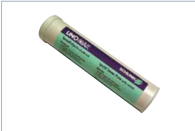
Kartusche Spezialfett Cartridge special grease