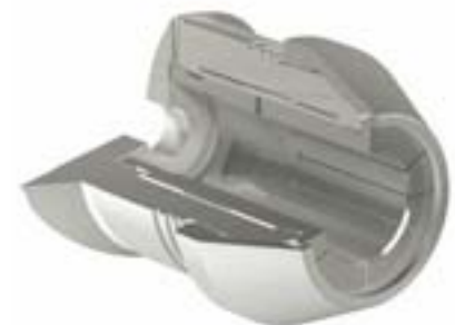
Zwischenbüchsen-sicherung mit Überwurfmutter Locking of intermediate sleeve with cap nut